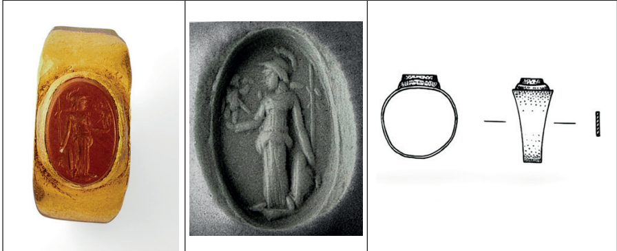
Görsel 15. Kırmızı Jasper Taşlı Altın Yüzük

Kırmızı Jasper Taşlı Altın Yüzük üzerinde, sola dönük duran Athena tasvir edilmiştir. Athena'nın başında Korint miğferi bulunmakta ve ileriye uzattığı sağ elinde zafer tanrıçası Nike'yi tutmaktadır. Sol elinde mızrak yer alırken, figürün ayaklarının dibinde bir kalkan ve zemin çizgisi detaylı bir şekilde taşta işlenmiştir. Bu kompozisyon, antik dönemin mitolojik simgelerini ve sanatsal işçiliğini yansıtarak dönemin ikonografik özelliklerini gözler önüne sermektedir (Görsel 15).