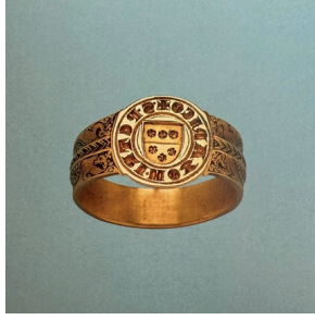
Görsel 9. Roma Dönemi Altın Yüzük