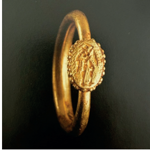
Görsel 5. Antik Yunan, MÖ 6. Yüzyıla Tarihlenen Altın Mühür Yüzük