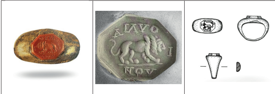
Görsel 17. Kırmızı Jasper Taşlı Saf Gümüş Yüzük

Görsel 17'de yer alan Kırmızı Jasper Taşlı Saf Gümüş Yüzük üzerinde, sağa doğru yürüyen bir aslan figürü tasvir edilmiştir. Figür, yer çizgisi ile detaylı bir kompozisyon oluştururken, çevresinde I-OYAIA-NOY yazısı negatif olarak yüzük taşına kazınmıştır. Aslan, antik dünyada güç, cesaret ve kraliyet sembolü olarak sıkça kullanılmış olup, bu tasvir yüzüğün statü ve anlamını güçlendiren önemli bir ikonografik öğe olarak öne çıkmaktadır. Kazıma tekniği ve detaylı işçilik, dönemin zanaatkarlık anlayışını yansıtan sanatsal bir örnek niteliğindedir.