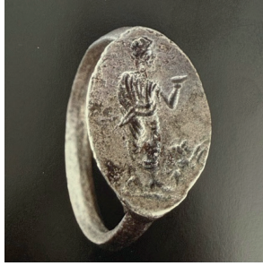
Görsel 6. Antik Yunan, MÖ 4. Yüzyıla Tarihlenen Gümüş Yüzük