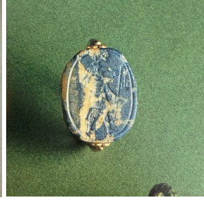
Görsel 4. 1504-1450 Yıllarına Tarihlenen Antik Mısır Lapis Lazuli Yüzük