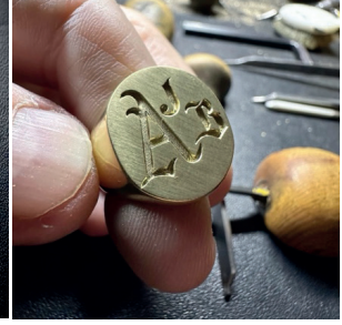
Görsel 14. Günümüz Endüstriyel Mühür Yüzük Tasarımı