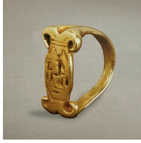
Görsel 3. Eski Mısır; 1379-1362 Yıllarına Tarihlenen Altın Mühür Yüzük