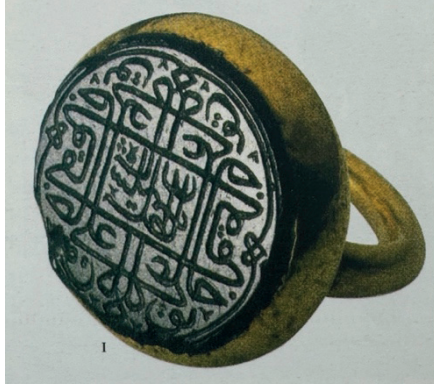
Görsel 11- Yavuz Sultan Selim Han'ın Kişisel Mührü Olan Altın Yüzük

resmi kimlik belirleme ve doğrulama aracı olarak hizmet etmiştir. Bu yüzükler sadece işlevsel değil, aynı zamanda takan kişinin statüsünün, gücünün ve sanatsal hassasiyetlerinin bir yansımasıdır; karmaşık tasarımlar ve kullanılan malzemeler Osmanlı zanaatkarlarının beceri ve yenilikçiliğini sergiler (Necipoglu, 2022). Görsel 11’de yer alan, Yavuz Sultan Selim’in kişisel imzasını taşıyan altın mühür yüzük, dönemin mücevher ve zanaatkarlık anlayışını yansıtan önemli bir örnek olarak değerlendirilebilir. Bu yüzük, hem sanatsal hem de tarihi açıdan Osmanlı dönemi mühür yüzüklerinin karakteristik özelliklerini göstermektedir.