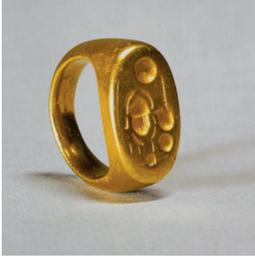
Görsel 2. Eski Mısır; 1336-1327 Yıllarına Tarihlenen Altın Mühür Yüzük