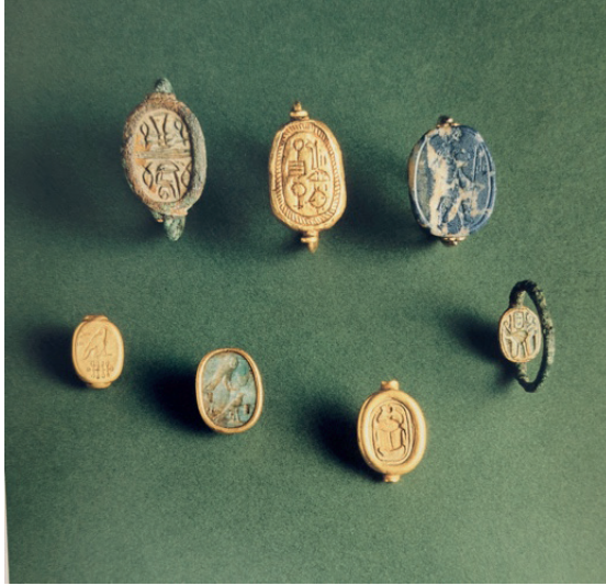
Görsel - 1 1504-1450 Yıllarına Tarihlenen Antik Mısır Kalıntıları

2023). Görsel-1 de yer alan yüzükler antik mısır dönemine ait altın bronz ve lapis lazuli gibi taşlardan yapılmıştır.