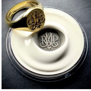
Görsel 13. Günümüz Endüstriyel Mühür Yüzük Tasarımı