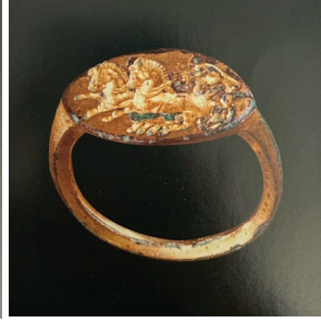
Görsel 7. Eski Yunan, MÖ 4. Yüzyıla Tarihlenen Bronz Yüzük

Antik Yunan dünyasının M.Ö. 1100 civarında çöküşü, yaşamın lükslerinin genellikle ihmal edildiği göreceli bir kemer sıkma dönemi getirmiş olsa da yüzük yapımı sanatı sonunda yenilenmiş bir güçle yeniden ortaya çıkmıştır (Higgins, 1969). Antik Yunan'da takı yalnızca süs eşyası olarak değil, statü, zenginlik ve dini ya da siyasi bağlılıkların güçlü sembolleri olarak hizmet etmiştir. Antik Yunan kuyumcularının önceden belirlenmiş standartlara göre mücevher yaratma konusunda benzer gelenekleri izlediğini göstermektedir (Higgins, 1969; Ridgeway, 1889).