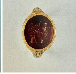
Görsel 10. Roma Dönemi Altın Yüzük

En eski Roma yüzüklerinin izi, antik Roma'nın kültürel ve sanatsal gelişimi üzerinde önemli bir etkiye sahip olan Etrüsk uygarlığına kadar sürülebilmektedir. Etrüskler metal işçiliğindeki becerileriyle ünlü ve mühür yüzükler de dahil olmak üzere takıları çok değerlidir. Roma İmparatorluğu genişledikçe, Etrüsk kuyumculuk gelenekleri ve teknikleri özümsemiş ve rafine edilerek farklı bir Roma stilinin yaratılmasına yol açmıştır. Antik Roma yüzüklerinin en dikkat çekici özelliklerinden biri, birincil malzeme olarak altının yaygın olarak kullanılmış olmasıdır (Oliver, 1966).