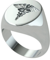
Görsel 12. Günümüz Endüstriyel Mühür Yüzük Tasarımı

Eserlerdeki temsili sembollerin, motiflerin ve yazıların analizi, bazı örneklerde yöneticilere ait özel işaretleri içeren kabartmalı tasarımlar gibi işlevler hakkında ipuçları sunmaktadır. Bu durum, söz konusu takıların devlet yönetimi ve yönetimle olan bağlantılarını ortaya koymaktadır (Karim, 2018).