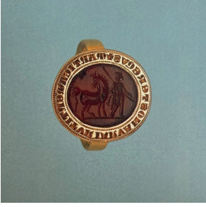
Görsel 8. Roma Dönemi Altın Yüzük