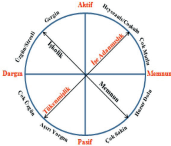
Şekil 1. Duygu Oluşumunda Merkez Etkisi (Kaynak: Russel, 2003; Aybas, 2014)

Buna karşılık ikinci yaklaşım, işe adanmışlık ve tükenmişliğin birbirinin tam karşıtı olmadığını, ancak ilişkili ve birbirini etkileyen iki ayrı kavram olduğunu ileri sürmektedir (Schaufeli vd., 2001). Bu yaklaşıma göre çalışanların duygu durumları tek boyutlu değil, karmaşık bir yapı göstermektedir.