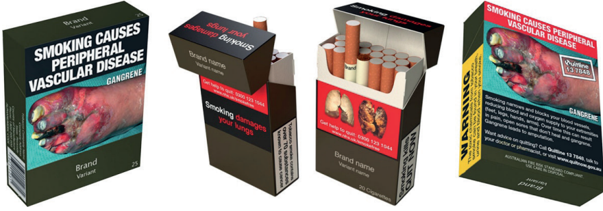
Resim 9. Sigara Paketi Sağlık Uyarı Bilgileri

Bu dönemde etik temelli caydırıcılık, geçici bir önlem ya da istisnai bir uygulama olmaktan çıkarak kurumsallaşmış bir tasarım yaklaşımı haline gelmiştir. Plain packaging, tasarımcıya “nasıl daha çekici olur?” sorusunu sormayı yasaklarken, “nasıl daha az cazip olur?” sorusunu zorunlu kılmaktadır (Resim 9). Bu tersine çevrilmiş tasarım mantığı, grafik tasarım tarihinde benzeri az görülen bir paradigmatik kırılmaya işaret etmektedir. Estetik değerler, bilinçli olarak bastırılmakta; görsel iletişim, davranış değişikliği yaratma hedefiyle yapılandırılmaktadır.