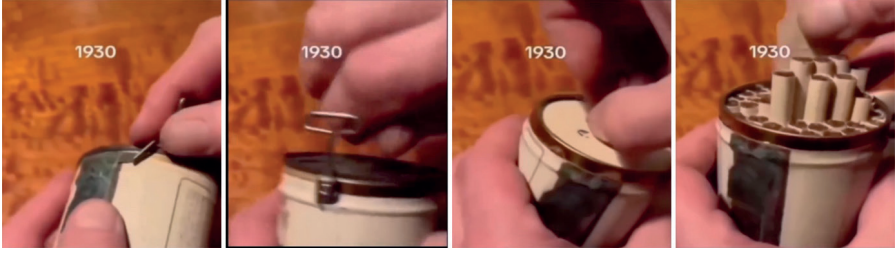
Resim 4. Silindirik Sigara Metal Kutu Açılışı, 1930

İkinci Dünya Savaşı sonrasına kadar uzanan bu süreçte sigara ambalajı, grafik tasarımın pazarlama odaklı doğasının en çarpıcı örneklerinden biri olarak değerlendirilebilir. Tasarımcılar, tüketicinin dikkatini çekmek, marka sadakati oluşturmak ve ürünü rakiplerinden ayırmak amacıyla estetik unsurları stratejik biçimde kullanmışlardır. Bu yaklaşımda grafik tasarım, toplumsal sonuçlarından bağımsız, nötr ve teknik bir pratik olarak konumlandırılmıştır. Ancak bu estetik başarı, ilerleyen yıllarda ortaya çıkacak etik tartışmaların da zeminini hazırlamıştır.