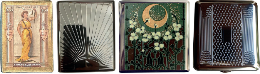
Resim 1. Art Deco Tütün Sigara Kutuları

Sigara ambalajında grafik tasarımın erken dönem gelişimi, 20. yüzyılın başında modern tüketim kültürünün yükselişiyle doğrudan ilişkilidir. Özellikle 1920–1950 yılları arasındaki dönem, ambalaj tasarımının yalnızca koruyucu bir yüzey olmaktan çıkarak, ürünün anlamını ve toplumsal konumunu inşa eden güçlü bir görsel iletişim aracına dönüştüğü bir evreyi temsil etmektedir. Bu dönemde sigara ambalajları, grafik tasarımın estetik olanaklarını yoğun biçimde kullanan, tüketim arzusunu tetikleyen ve sigarayı modern yaşamın simgelerinden biri haline getiren görsel stratejilerle şekillenmiştir.