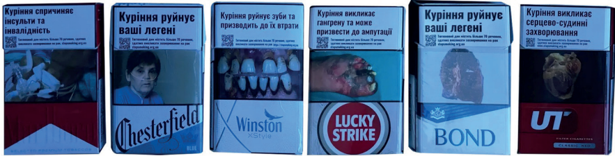
Resim 8. Sigara Ambalajı Üzeri Sağlık Uyarıları Görsel Kullanımı

1980–2010 aralığı, grafik tasarım açısından yalnızca biçimsel değil, aynı zamanda mesleki bir kırılmayı da beraberinde getirmiştir. Tasarımcı, artık ürünün çekiciliğini artıran bir aktör olmaktan ziyade, kamu sağlığı mesajlarının taşıyıcısı konumuna yaklaşmıştır. Bu durum, grafik tasarımın tarafsız bir iletişim aracı olduğu yönündeki kabulleri değiştirip tasarımcının etik sorumluluğu daha görünür hale gelmiştir. Ambalaj, bu bağlamda estetik bir nesne olmaktan çok, davranış değiştirmeye yönelik bir iletişim yüzeyi olarak yeniden tanımlanmıştır.