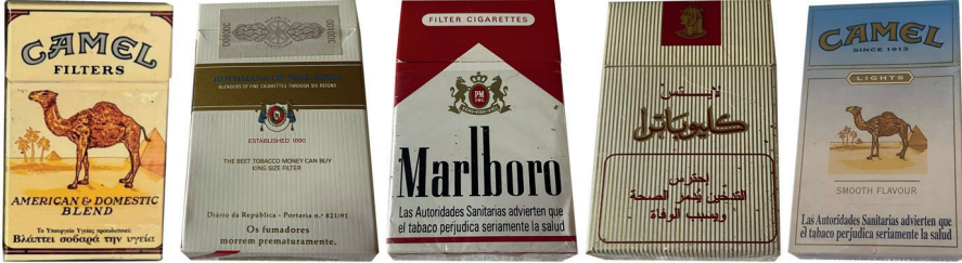
Resim 7. Sigara Ambalajı Üzeri Tipografik Sağlık Uyarıları

Bu dönemde sigara ambalajlarında görülen en belirgin değişim, sağlık uyarılarının ambalaj yüzeyine metinsel olarak eklenmesidir. İlk örneklerde uyarılar, genellikle küçük puntolarla, ambalajın arka yüzünde veya görsel hiyerarşinin en alt seviyesinde konumlandırılmıştır (Resim 7). Grafik tasarımın temel önceliği hâlâ marka kimliğini ve çekiciliği korumak olsa da, sağlık uyarılarının varlığı ambalajın bütüncül estetik kurgusunu zorunlu olarak dönüştürmüştür. Böylece ambalaj, ilk kez çelişkili mesajlar taşıyan bir iletişim yüzeyine dönüşmüştür: Bir yanda tüketimi teşvik eden görsel dil, diğer yanda tüketimin zararlarına işaret eden metinsel uyarılar.