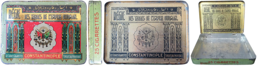
Resim 5. Eski Antika Osmanlı Tütün Sigara Kutusu, İstanbul, Osmanlı İmparatorluğu Arması, Tuğra, 1910

İkinci Dünya Savaşı sonrasına kadar uzanan bu süreçte sigara ambalajı, grafik tasarımın pazarlama odaklı doğasının en çarpıcı örneklerinden biri olarak değerlendirilebilir. Tasarımcılar, tüketicinin dikkatini çekmek, marka sadakati oluşturmak ve ürünü rakiplerinden ayırmak amacıyla estetik unsurları stratejik biçimde kullanmışlardır. Bu yaklaşımda grafik tasarım, toplumsal sonuçlarından bağımsız, nötr ve teknik bir pratik olarak konumlandırılmıştır. Ancak bu estetik başarı, ilerleyen yıllarda ortaya çıkacak etik tartışmaların da zeminini hazırlamıştır.