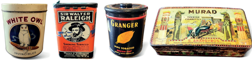
Resim 2. Çeşitli Antika Tütün Sigara Kutuları, 1920.

Bu dönemde grafik tasarım, sigarayı tüketim nesnesi olarak hem de kültürel bir kimlik göstergesi olarak temsil etmiştir. Ambalajlar; şehirli, özgür, zarif ve çağdaş birey imgesini besleyen sembolik anlatılar üretmiştir. Kadın figürlerinin ambalajlarda görünürlük kazanması, sigaranın toplumsal cinsiyet bağlamında da yeniden kodlandığını göstermektedir (Resim 3). Özellikle 1930'lu yıllardan itibaren sigara, kadın özgürlüğü ve modernleşme söylemleriyle ilişkilendirilmiş; ambalaj tasarımları bu ideolojik çerçeveyi destekleyen estetik kararlarla biçimlendirilmiştir. Grafik tasarım, bu süreçte yalnızca biçimsel bir araç değil, kültürel değerleri yeniden üreten bir temsil mekanizması olarak işlev görmüştür.