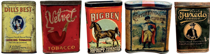
Resim 3. Çeşitli Kıvrımlı Kesimli Sigara Metal Kutuları, 1930

Bu dönemde grafik tasarım, sigarayı tüketim nesnesi olarak hem de kültürel bir kimlik göstergesi olarak temsil etmiştir. Ambalajlar; şehirli, özgür, zarif ve çağdaş birey imgesini besleyen sembolik anlatılar üretmiştir. Kadın figürlerinin ambalajlarda görünürlük kazanması, sigaranın toplumsal cinsiyet bağlamında da yeniden kodlandığını göstermektedir (Resim 3). Özellikle 1930'lu yıllardan itibaren sigara, kadın özgürlüğü ve modernleşme söylemleriyle ilişkilendirilmiş; ambalaj tasarımları bu ideolojik çerçeveyi destekleyen estetik kararlarla biçimlendirilmiştir. Grafik tasarım, bu süreçte yalnızca biçimsel bir araç değil, kültürel değerleri yeniden üreten bir temsil mekanizması olarak işlev görmüştür.