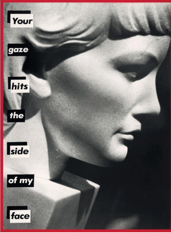
Görsel 4. Barbara Kruger, "Your Gaze Hits the Side of My Face", 1981.

Kruger, "Untitled (Your gaze hits the side of my face)" (1981) eserinde kadın bedenini, Laura Mulvey'in (1975) kavramsallaştırdığı nesneleştirilen erkek bakışının bir hedefi olarak konumlandırır (Soley, 2022). Sanatçı eserinde, mekanik ve donuk bir ifadenin yer aldığı bir kadın büstü görseli ile sol bloğa negatif ve pozitif olarak yerleştirdiği metni bir arada kurgulamıştır (Çulha, 2019). Folland'a (2020) göre, görseldeki kadın heykeli, ataerkil fantezilere uygun olarak "bakılacak pasif bir nesne" şeklinde taşlaşıp eylemsizleşirken; yanındaki vurucu metin bu edilgenliği reddederek aktif bir direniş gösterir. Eserde birbiriyle bütünleşen bu gerilim, Laura Mulvey'in 1975'te formüle ettiği "eril bakış" kuramınının (Folland, 2020) ve John Berger'in "erkekler seyrederek, kadınlar seyredildiğini seyrederek" tespitiyle nesneleştirme durumunun