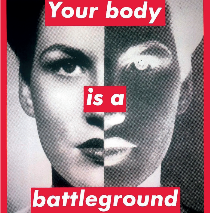
Görsel 5. Barbara Kruger, "Untitled (Your body is a battleground)", 1989.

Sanatçı, diğer çalışmalarında olduğu gibi kırmızı zemin üzerine beyaz, kalın Futura Bold Oblique fontu ile karakterize yazıları kullanarak izleyicide uyarıcı bir his yaratır. Fotoğrafta görünen portrenin pozitif-negatif olarak ikiye ayrılması toplumsal olarak bölünmeye, kutuplaşmaya ve kadın bedeni üzerindeki mücadeleye göndermede bulunur. Piejko (t.y.), sanatçının bu eseri 1989 yılında Washington'da gerçekleşen ve kadın haklarını savunan büyük yürüyüş (Women's March) için bir afiş olarak tasarladığını belirtir. Eserin doğuşu, ABD'de kürtaj haklarını güvence altına alan Roe v. Wade kararının yasal tehdit altında olduğu, siyasi ve toplumsal kutuplaşmanın zirve yaptığı bir döneme denk gelir. Bu tarihsel bağlam, Kruger'ın tasarım dilini sadece estetik bir tercih olmaktan çıkarıp kamusal alanda bir otorite kurma ve doğrudan