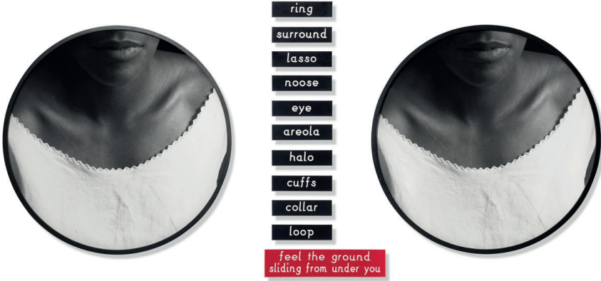
Görsel 2. Lorna Simpson, Untitled (Two Necklines) , 1989.

Simpson’ın çalışmalarında metin, sadece imgeye eşlik eden bir açıklama değil; anlamın sürekli yer değıştirdiğı, kaygan bir zemin inşa eden tasarım ögesidir. Jones’un (2011) belirttiğı üzere, sanatçı eşsesli veya birbiriyle ilişkili kelimelerin farklı çağrışımlarından faydalanarak tekil bir anlam arayışını sekteye uğratar. Bu durum, izleyicinin imgeye dair net bir yargıya varmasını engeller. Sontag’ın (1977) “fotoğrafın dilsizliğı” olarak tanımladığı o sessiz boşluk, Simpson tarafından kelime oyunları ile doldurulur; ancak bu doluluk izleyiciyi rahatlatmak yerine, anlamın ne kadar kırılğan ve manipölasyona açık olduğunu gösterir. Untitled (2 Necklines) (1989) adlı çalışması (Görsel 2), bu anlatıya önemli bir örnek oluşturur.