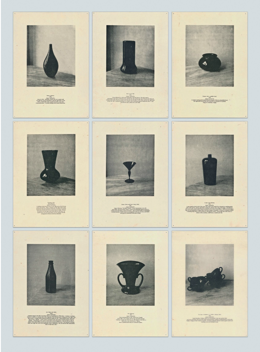
Görsel 3. Lorna Simpson, 9 Props, 1995. Kaynak: https://lsimpsonstudio.com/felt-newsprint-works/9-props-1995

9 Props eserinde sanatçı, yün paneller üzerine basılmış dokuz adet litografi kullanır ve bu çalışmalar duvarda bir ızgara biçiminde düzenlenerek sunulur. Boone'un (2020) söylemiyle, sanatçının daha önce yaptığı birkaç işinde de olduğu gibi keçeyi tercih etmesi, esere üç boyutlu bir derinlik katarken, görünür