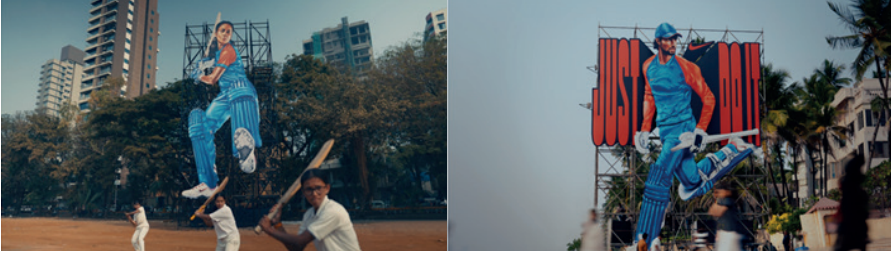
Görsel 2. Nike “Self-Belief” Açık hava Reklam Kampanyası (Mumbai, Hindistan)

Kampanyada olumlu ve olumsuz kullanıcı yorumlarının birlikte kullanılması, reklam tasarımında şeffaflık ve güven kavramlarının görsel iletişim aracılığıyla aktarılabilmesini ortaya koyar. Grafik tasarım, marka ile hedef kitle arasında güven ilişkisi kuran stratejik bir iletişim alanı olarak konumlanır. Açık hava yüzeylerinin sosyal medya yorumlarıyla yeniden kurgulanması, grafik tasarımın fiziksel ve dijital mecralar arasında geçişken bir anlatım alanı oluşturduğunu gösterir.