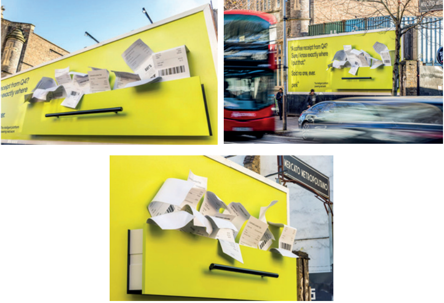
Görsel 3. Perk Finans Uygulaması İçin Tasarlanan Açık hava Reklam Kampanyası