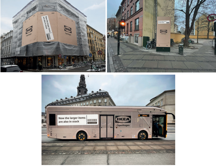
Görsel 4. IKEA Açık hava Reklam Kampanyası (Kopenhag, Danimarka)