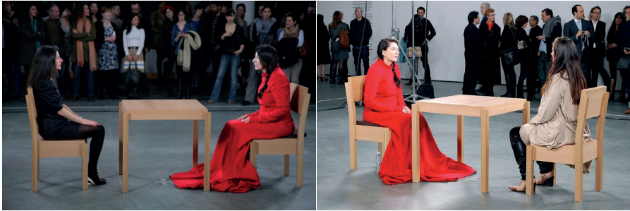
Görsel 4-5: Marina Abramovic, "Sanatçı Burada", 2010, MoMA (Modern Sanat Müzesi), New York.

Marina Abramovic'in Modern Sanat Müzesi'nde (MoMA) sergilediği "Sanatçı Burada" (2010) adlı performans eseri, ilişkisel sanatın bir paradigmasıdır. Bu eserde Abramovic, bir masada sessizce oturarak galeri ziyaretçilerini karşısına oturmaya ve düşünceli bir varlık alışverişine girmeye davet etti. Bu doğrudan deneyim, kelimelere gerek duymadı ve insan bağlantısının gücünü vurgulayarak, katılımcıların paylaşılan sessizlik ve odaklanmış dikkat yoluyla kendileriyle ve birbirleriyle karşılaşmalarını sağladı.