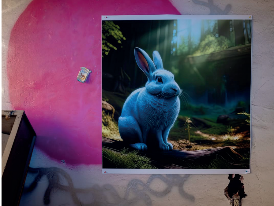
Görsel 5 - Seven Song Birds and a Rabbit , 1995-2025, ( https://www.instagram.com/p/DVNe8ryFVIA/?img_index=1 )

gerçekleşen bir eylem değil, aynı zamanda sayısal üretim süreçlerinin mekana sızması anlamına gelir. Bu geçiş, fotoğrafın belgeleyici rolünü sürdürürken aynı zamanda temsil katmanlarının çoğalmasına ve gerçek ile simülasyon arasındaki sınırın daha da belirsizleşmesine yol açar.