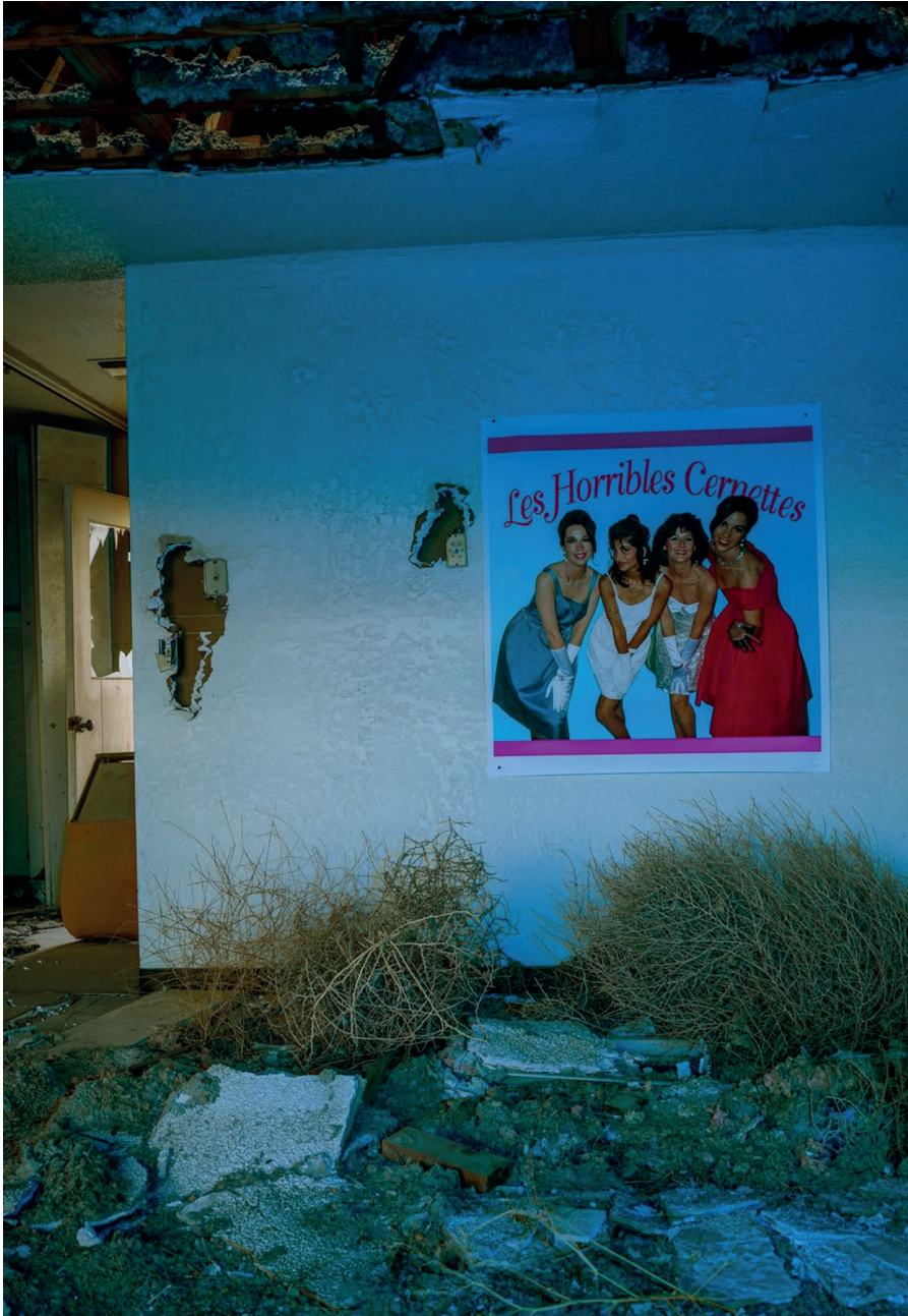
Görsel 9 - John Divola, 2021, First Photograph on Wall , ( https://www.instagram.com/p/DUxEIUnlb3v/?img_index=1 )

Divola'nın iki fotoğrafı da çekilmiş ilk fotoğraf ve internete yüklenmiş ilk fotoğrafın duvara yapıştırılıp yeniden fotoğraflanmış versiyonu arasındaki