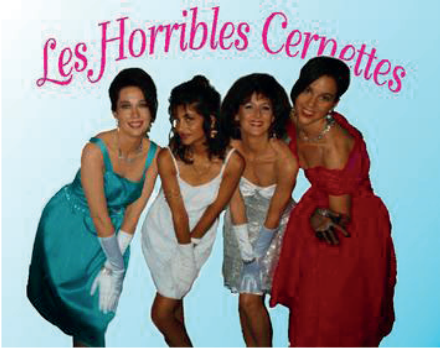
Görsel 7 - Les Horribles Cernettes , İnternete Yüklenen İlk Fotoğraf, 1992, ( https://en.wikipedia.org/wiki/Les_Horribles_Cernettes )

İnternete yüklenen ilk fotoğrafın kalitesiz görseli (poor image) üzerinden bakıldığında (Görsel 9) temsilin doğası daha da karmaşık bir hal alır. Fotoğraf artık yalnızca fiziksel bir mekana bağlı değildir çevrimiçi ortamda çoğaltılmış ve küresel erişime açılmış bir nesneye dönüşmüştür. İzleyen, görüntüyü doğrudan mekanda deneyimlemek yerine, dijital bir arayüz aracılığıyla karşılar ve böylece mekan ile zamanın geleneksel bağları kırılır. Orijinal çekimle kıyaslandığında, çevrimiçi çoğaltım fotoğrafın “aura”sını zayıflatır, ancak aynı zamanda yeni bir estetik ve kavramsal gerilim yaratır. Görüntü hem tarihsel referansını hem de dijital çoğaltımın yaygınlığını aynı anda taşır.