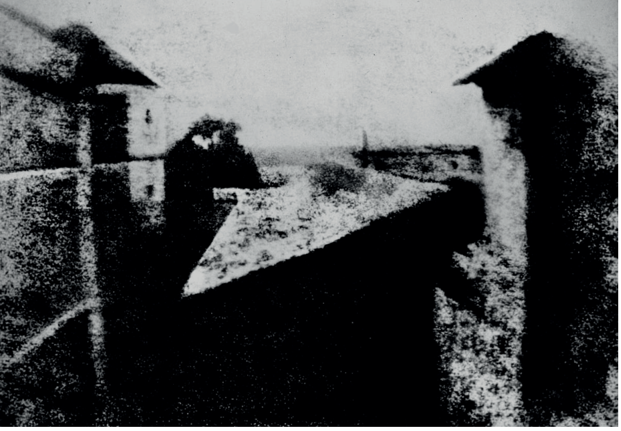
Görsel 6 - Le Gras estate at Saint-Loup-de-Varennes, France, Joseph Niepce, 1826, ( https://cool.culturalheritage.org/byorg/abbey/an/an26/an26-3/an26-307.html )

fiziksel ve dijital katmanları bir araya getirerek temsilin çok katmanlı doğasını ve gerçeklik ile simülasyon arasındaki sürekli gerilimi vurgular.