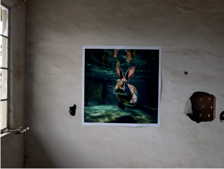
Görsel 3 - Seven Song Birds and a Rabbit , 1995-2025, ( https://www.instagram.com/p/DVNe8ryFVIA/?img_index=1 )