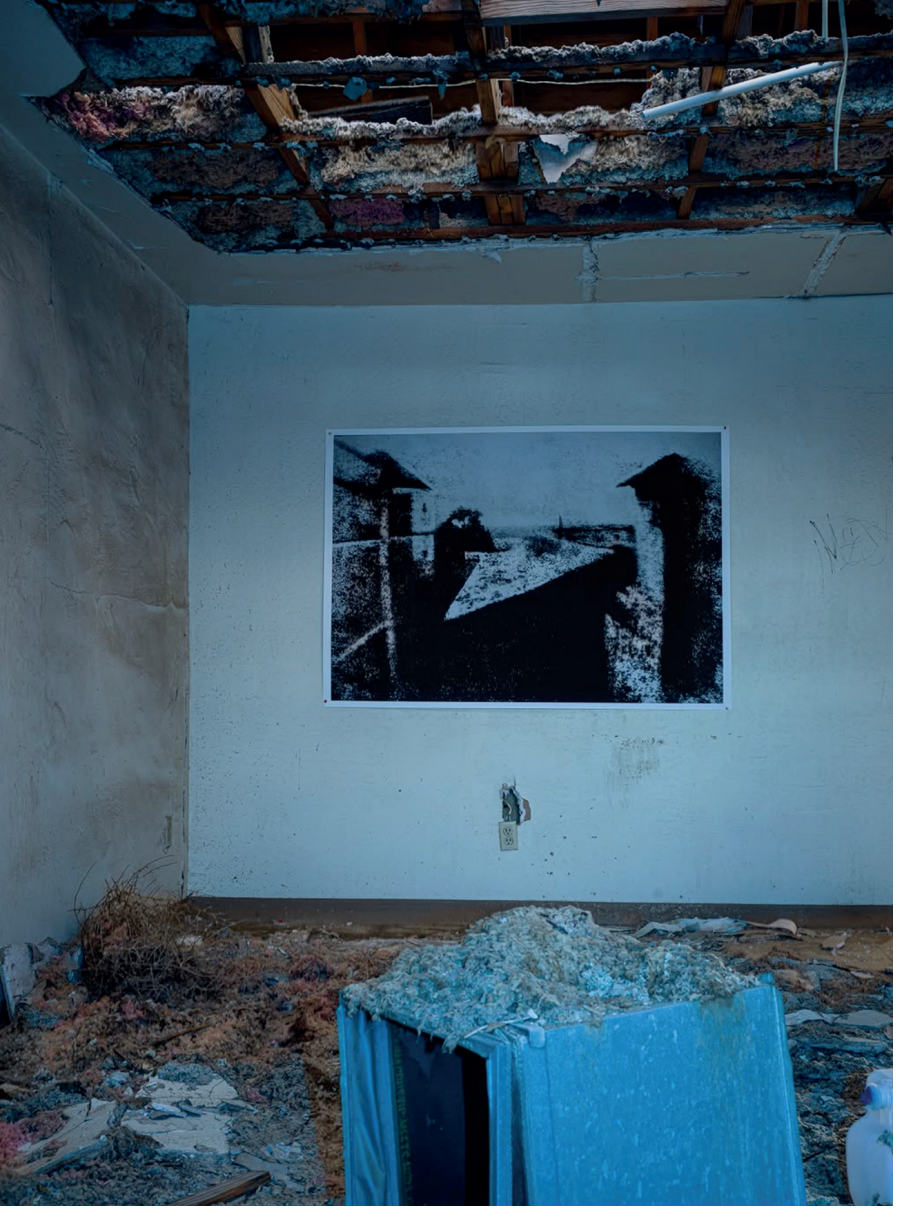
Görsel 8 - John Divola, 2021, First Photograph on Wall , ( https://www.instagram.com/p/DUxEIUnlb3v/?img_index=1 )

(orijinal kayıt, fiziksel kopya ve dijital çoğaltım) bir diğeriyle iç içe geçer ve gerçeklik ile simülasyon arasındaki sürekli gerilim daha da görünür hale gelir. Bu bağlam, medyatik çoğaltımın sanat deneyimindeki rolünü ve çevrimiçi erişim ile mekansal deneyim arasındaki ilişkiyi düşünmek için kritik bir çerçeve sunar.