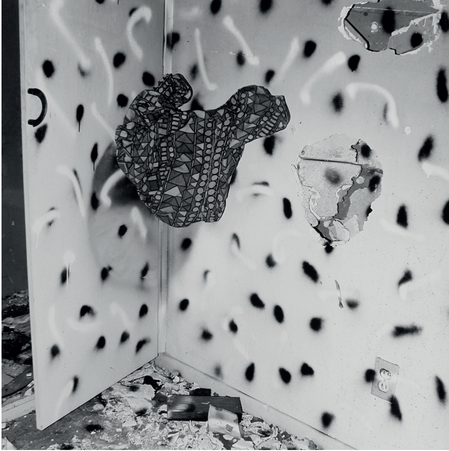
Görsel 2 - Form Vandalism Series, 74V02, 1974, ( https://www.vice.com/en/article/john-divolas-photographs-resist-all/ )

“Vandalism”, yalnızca bir mekansal müdahale değil, aynı zamanda görüntünün nasıl üretildiği ve nasıl gerçeklik iddiası kurduğu üzerine düşünmeye zorlayan bir pratik olarak değerlendirilebilir.