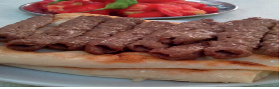
Resim 6. Burdur şiş https://ci.turkpatent.gov.tr/coğrafi-isaretler/liste (25.02.2026)