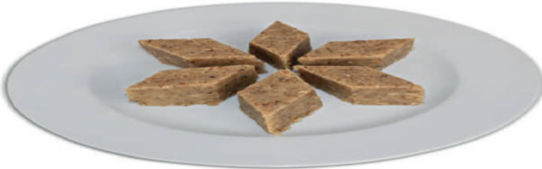
Resim 8. Burdur ceviz ezmesi https://ci.turkpatent.gov.tr/cograf-i-isaretler/liste (25.02.2026)

Burdur Ceviz Ezmesi, Burdur yöresine özgü geleneksel bir tatlı olup, bölgenin coğrafi yapısının ceviz yetiştiriciliğine elverişli olması nedeniyle yerel mutfak kültüründe önemli bir yer edinmiştir. Tarihsel olarak uzun yıllardır yalnızca Burdur’da üretilen bu ürün, yöresel ikram geleneğinin ve hediyelik gıda kültürünün önemli bir parçası olarak kabul edilmektedir. Burdur Ceviz Ezmesi; ceviz, irmik ve şekerin eşit oranlarda karıştırılmasıyla hazırlanan, üretim sürecinde kaynatma, kavurma veya tavlama gibi yoğun ısıl işlemler uygulanmayan bir gıda ürünüdür. Üretim aşamasında ceviz ve irmik kaynar şerbet içerisine eklenerek karıştırılmakta ve böylece hammaddelerin doğal yapısı büyük ölçüde korunmaktadır. Bu üretim yöntemi, ceviz ve irmiğin kimyasal ve besinsel özelliklerinin bozulmadan kalmasını sağlayarak ürünün besin değerini artırmaktadır. Özellikle ceviz; fosfor, kalsiyum, potasyum, magnezyum ve demir gibi mineraller açısından zengin olup sinir sistemi fonksiyonlarının desteklenmesi, kas dokusunun çalışması, kemik ve diş sağlığının korunması ile oksijen taşınımı gibi fizyolojik süreçlerde önemli rol oynamaktadır. Bunun yanı sıra irmik ve şeker, günlük enerji gereksiniminin karşılanmasına katkı sağlayan önemli karbonhidrat kaynaklarıdır. Bu özellikleriyle Burdur Ceviz Ezmesi hem geleneksel üretim yöntemi hem de besin değeri bakımından yöresel gastronomi içerisinde sağlıklı ve dengeli bir gıda ürünü olarak değerlendirilmektedir. (Türk patent, 2026).