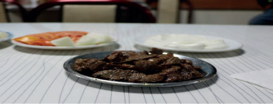
Resim 5. Göllüsar yaprak kavurma https://ci.turkpatent.gov.tr/coGRAFI-Isaretler/liste (25.02.2026)