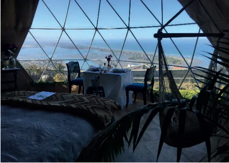
Kaynak: (Shelter Dome, 2025)