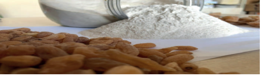
Resim 9. Bucak Saleb i https://ci.turkpatent.gov.tr/coGRAFI-IsAretler/liste (25.02.2026)