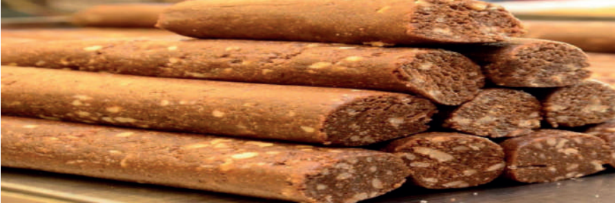
Resim 10. Burdur Haşhaş helvası https://ci.turkpatent.gov.tr/cografisiaretler/liste (25.02.2026)

sert kütüklerle ezilmesi ve üzüm pekmezi ile karıştırılmasıyla hazırlanan helva, zaman içerisinde yapılan bileşen ilaveleri ve pişirme tekniklerinin gelişmesiyle günümüzdeki karakteristik formunu kazanmıştır. Bu yönleriyle Burdur Haşhaş Helvası, yöresel hammaddeler ve geleneksel üretim yöntemlerinin birleşimini yansıtan özgün bir gastronomik ürün olarak değerlendirilmektedir.