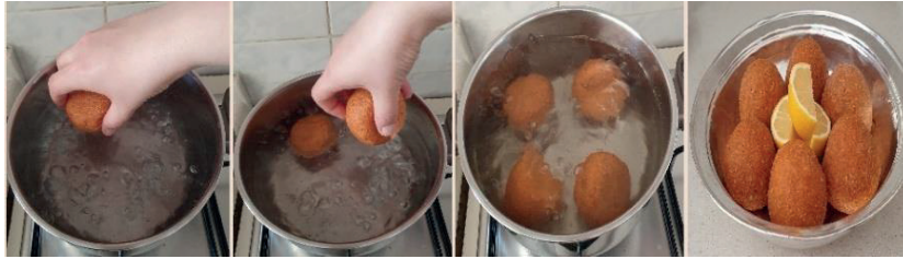
Şekil 6: Köftelerin Haşlama Tekniği ile Pişirilmesi

Haşlama tekniğinde tencerede iki litre su kaynatılır. İçine bir çay kaşığı tuz, bir- iki damla limon suyu eklenir. Görüşmelerde limon yerine kimi zaman nar ekşisi ya da limon tuzu da eklenebileceğini belirtmişlerdir (K5, K8). İçli köfteler kaynayan suyun içine dikkatli şekilde eklenir. Suya atıldığı zaman dibe çöken içli köfteler suyun yüzeyine çıktığı zaman pişmiş olduğu anlamına gelir. Kevgir yardımıyla pişen köfteler servis tabağına alınarak, sıcak olarak servis edilmektedir (Öney, 2018; Değer, 2024; Türk Patent, 2024; K1, K2, K3, K4, K5, K6, K7, K8, K9, K10).