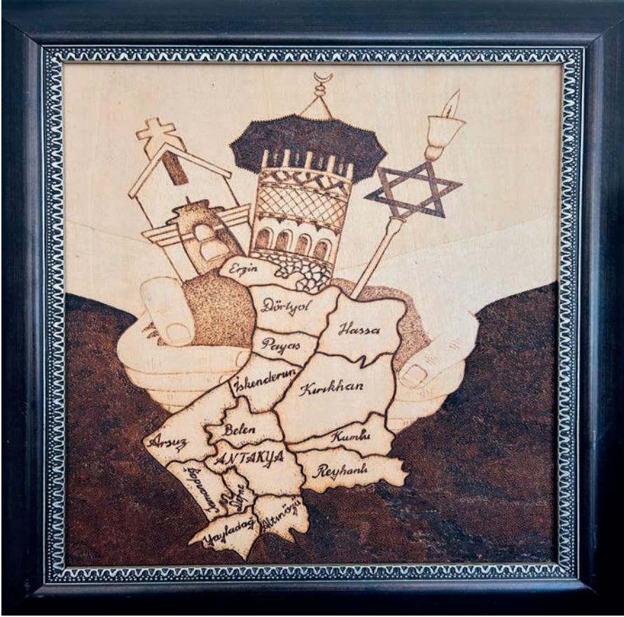
Foto 2.17. Ahşap yakma ile yapılan tablo