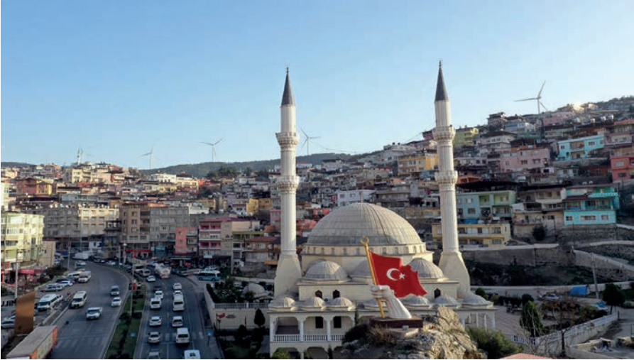
Kaynak: Yazarlar, 2023.