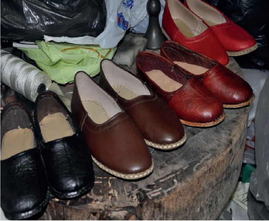
Foto 2.22. Yemeni