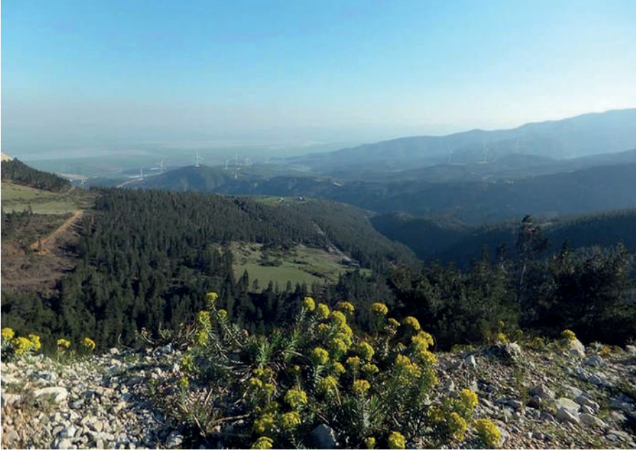
Foto 2.45. Belen Geçidi Tabiat Parkı