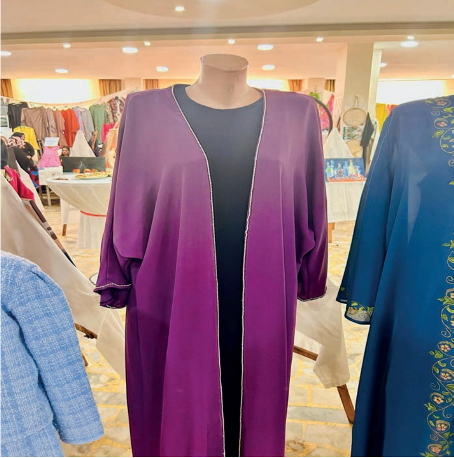
Foto 2.21. Belen geleneksel kadın kıyafeti