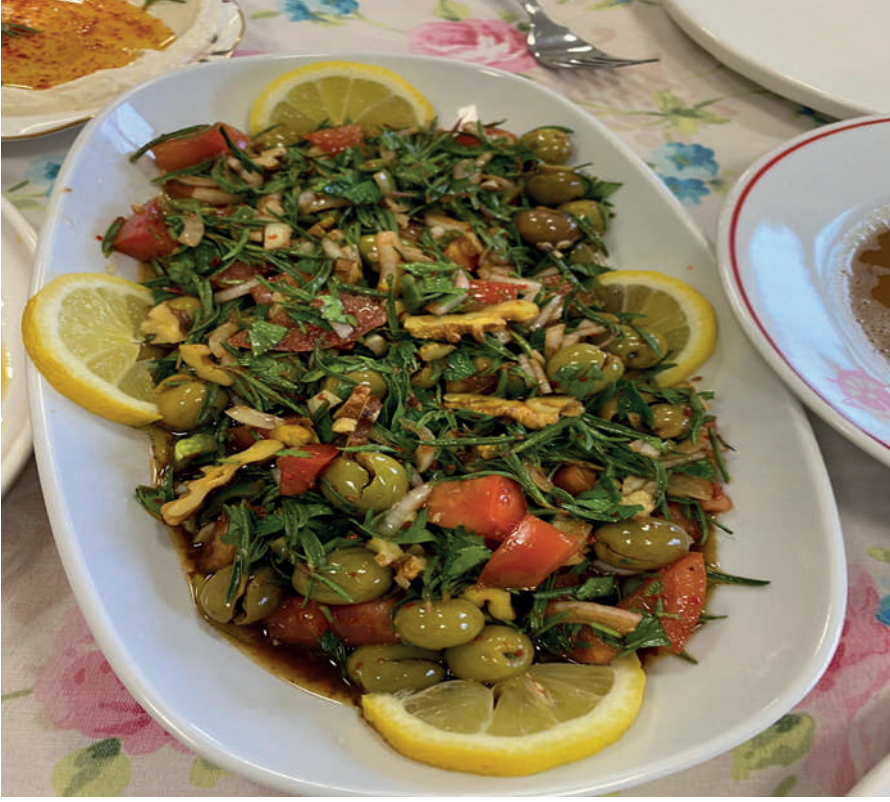
Foto 2.32. Zeytin salatası