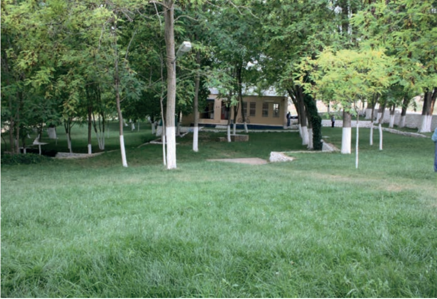
Kaynak: Yazarlar, 2023.

Atik Çınaraltı Mesire Alanı: Atik yaylasında bulunan diğer bir mesire alanı da “Atik Çınaraltı Mesire Alanı”dır. Belen merkeze 7 km uzaklıkta bulunmaktadır. Girişlerin ücretli olduğu anlaşılmaktadır. Su, wc, oturma alanları mevcuttur (belen.gov.tr, 2024).