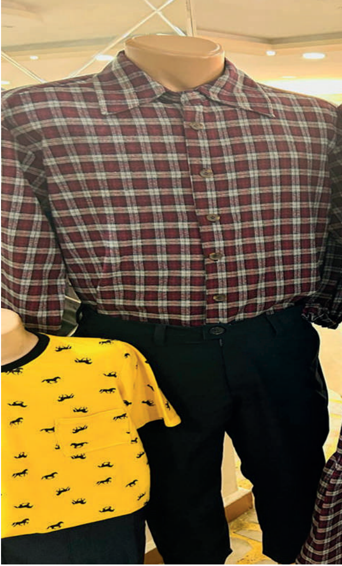
Foto 2.23. Belen geleneksel erkek kıyafeti