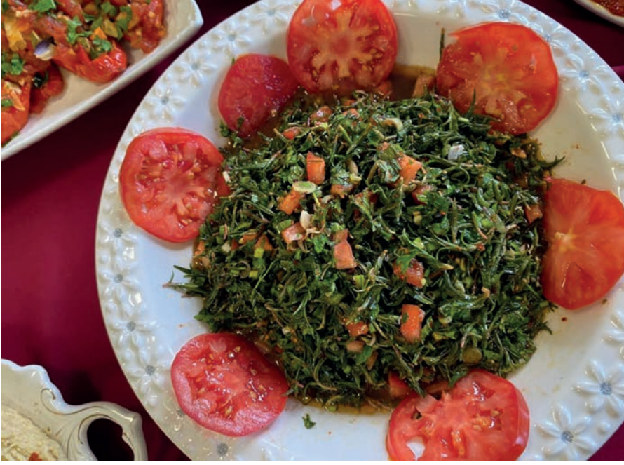
Foto 2.30. Zahter salatası

Kaynak: Belen Halk Eğitimi Merkezi, 2024.