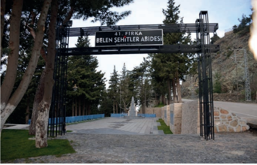
Foto 2.15. Belen Şehitler Abidesi