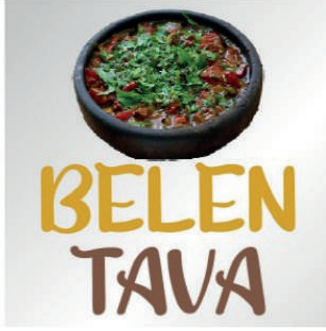
Foto 2.24. Belen tava logosu

Kaynak: Sanayi ve Teknoloji Bakanlığı Türk Patent ve Marka Kurumu, 2025.