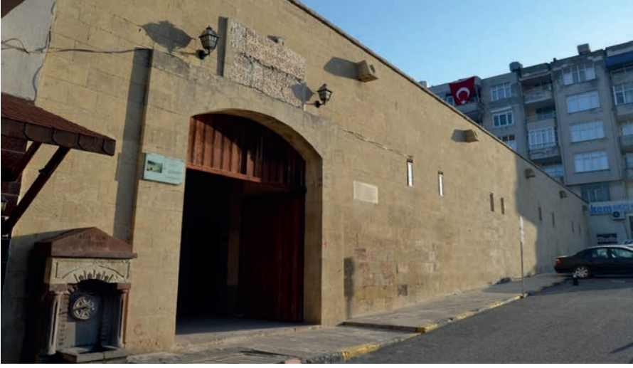
Foto 2.9. Kanuni Sultan Süleyman Kervansarayı