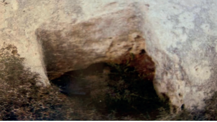
Foto 2.16. Kaya mezarları