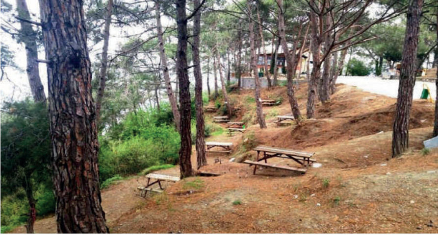
Kaynak: Yazarlar, 2023.

Soğukoluk Tuncerin Yeri Mesire Alanı: Belen merkeze 12 km mesafede dağın denize bakan yamacında serin hava eşliğinde günün yorgunluğunun atılabileceği nadir mekanlardan biri olarak hizmete sunulmaktadır. Özel işletmeye ait olan bu mekana giriş ücretli olduğu anlaşılmaktadır (belen.gov.tr, 2024).