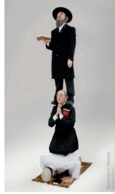
Görsel 5. Eugenio Merino Stairway to Heaven (Cennete Giden Merdiven) , 2010.