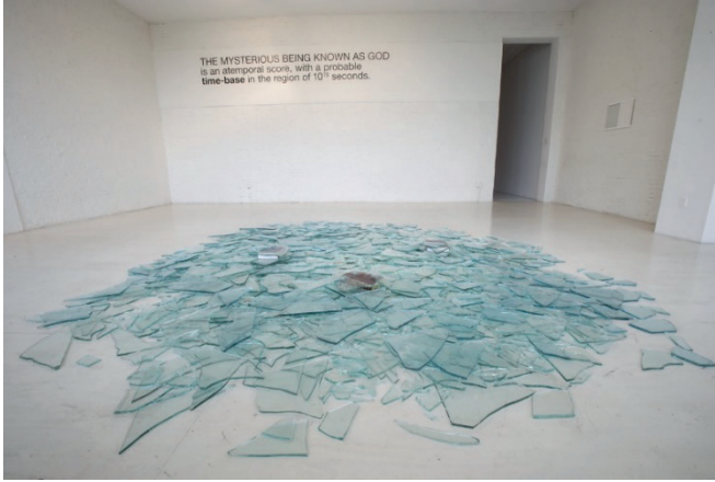
Görsel 6. John Latham, God is Great (#4) Tanrı Büyüktür 4, 200 .

Son olarak kışkırtıcı yönüyle anılan İngiliz kavramsal sanatçı John Latham, cam, tuval ve kitap gibi farklı malzemeleri bir araya getirerek kolaj, yerleştirme ve heykel çalışmaları ile inanç ve bilgiyi sorgulayan eleştirel bir dil oluşturmuştur. Latham'ın düşüncesi, nesnelere mekân içinde tanımlamak yerine olayları zaman temelli bir bütün olarak kavrama üzerinedir. Sanatçının “düz zaman” anlayışı, farklı disiplinleri aşarak sosyal, ekonomik, politik ve estetik alanları ortak bir yapı içinde birleştirir. (Serpentine Galleries, 2017). Sanatçının bu yaklaşımı, inanç sistemlerine yönelik eleştirilerinde de açıkça görülür öyle ki