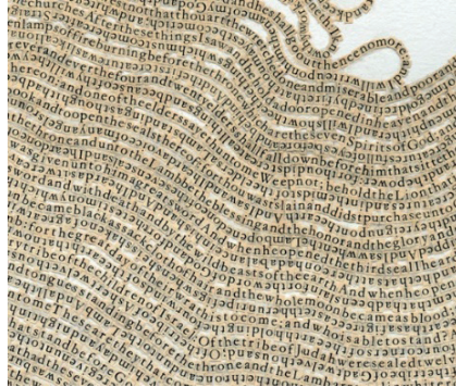
Görsel 1. Meg Hitchcock, (Throne) Taht , 113,03 x 76,2 cm, 2012.