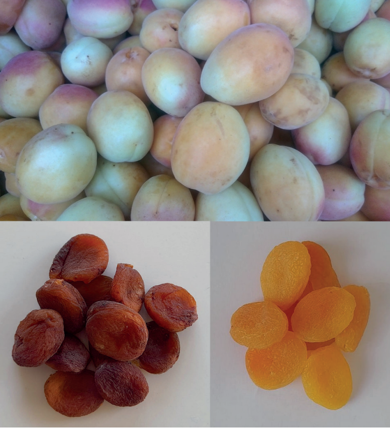
Şekil 2. Kayısı meyvelerinin taze ve kurutulmuş örnekleri

Bitkisel üretimin en uygun şekilde gerçekleştirilmesi; toprağın fiziksel, kimyasal ve biyolojik özellikleri ile topoğrafya, iklim ve rakım gibi temel parametrelerin dikkate alınmasına bağlıdır (Yanardağ, 2025). Elverişli coğrafi konumu ve çeşitlilik gösteren iklim koşulları, Türkiye'yi çok çeşitli meyve türleri için ideal bir yetiştirme alanı haline getirmektedir (Saridas vd., 2023). Türkiye, kayısı üretiminde dünyada lider konumundadır (Ayaz ve Bolu, 2012; Karakaş ve Öztürk, 2017). Türkiye'de kayısı, Karadeniz çevresindeki oldukça nemli bölgeler ile Anadolu'nun soğuk ve dağlık alanları dışında neredeyse tüm bölgelerde yetiştirilebilmektedir (Asma vd., 2007). Türkiye'de ve dünyada önemli kayısı üretim merkezlerinden biri olan Malatya, yüksek üretim potansiyeline sahip olan bir ilimizdir (Şekil 3) (Acarsoy Bilgin vd., 2023). Malatya toprakları; genel olarak yüksek kireç içeriğine, nötr ile hafif alkali arasında değişen pH değerine ve yüksek düzeyde kalsiyum ile potasyum içeriğine sahiptir (Yanardağ, 2025).