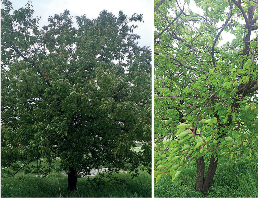
Şekil 3. Malatya ilinden kayısı ağacı örnekleri

Bu tip avantajlarına ilaveten, geç ilkbahar donları, ürün kayıplarına neden olan en önemli sorunlardan biridir. Düşük sıcaklıklar, çiçeklerde zarara yol açmakta ve buna bağlı olarak meyve tutumu ve verim azalmaktadır (Acarsoy Bilgin vd., 2023). Ayrıca, toprakta, mikro besin maddelerinin sınırlı olması, kayısı verimini sınırlandırmaktadır (Yanardağ, 2025). Bununla birlikte, kayısıların hastalıklara karşı düşük dirençleri, yeni yetiştirme ortamlarına adaptasyon yeteneğini sınırlamakta ve dolayısıyla bu türün yayılışını kısıtlamaktadır (Jalobã vd., 2022). Bunlara ilaveten zararlı böcekler; ürün, kalite ve ağaç kayıplarına neden olabilmektedir (Ayaz ve Bolu, 2012).