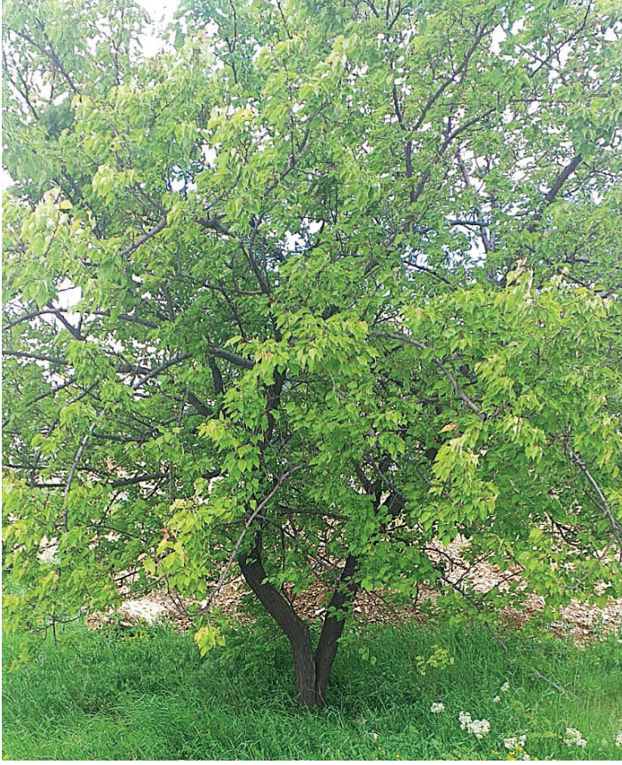
Şekil 1. Kayısı ağacı

Kayısı ağacının sert çekirdekli meyveleri, zengin bir fitokimyasal bileşime (şekerler, proteinler, yağ asitleri, ham lif, toplam mineraller, vitaminler, organik asitler, fenolik bileşikler, sterol türevleri, karotenoitler, uçucu bileşikler vb.) sahiptir (Alajil vd., 2021; Al-Saif vd., 2023). Meyve rengi, sarıdan turuncuya kadar değişmekte; güneşe daha fazla maruz kalan yüzeylerde ise, çoğunlukla kırmızımsı bir renklenme oluşmaktadır (Kumar vd., 2024). Kayısı meyveleri hem taze hem de kurutulmuş olarak tüketilmektedir (Şekil 2) (Karataş, 2021; Karlıdağ vd., 2022). Bununla birlikte; meşrubatlara, meyve suyuna, liyofilize ürünlere, jöle ve reçellere işlenerek tüketime sunulmaktadır (Al-Soufi vd., 2022). Meyvesinin kalitesi ve teknolojik özellikleri, kayısıyı tüketiciler arasında en çok beğenilen meyve türlerinden biri yapmaktadır (Jalobā vd., 2022). Dünyada en geniş alanda yetiştiriciliği yapılan sert çekirdekli meyve türlerinden biri olan kayısı (Karlıdağ vd., 2022), erik ve şeftaliden sonra ekonomik açıdan en önemli üçüncü çekirdekli meyve konumundadır (Alajil vd., 2021; Al-Soufi vd., 2022).