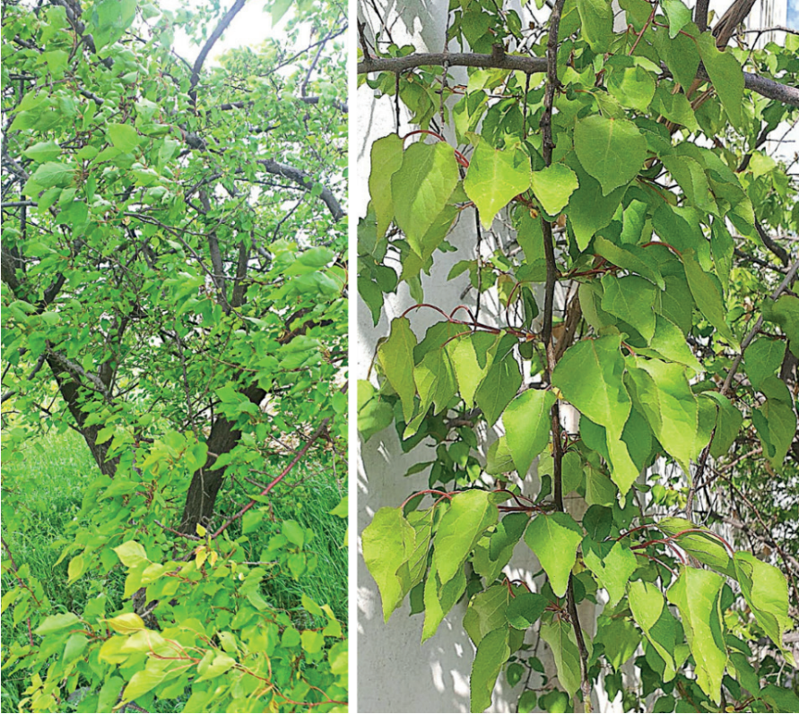
Şekil 4. Kayısı yaprakları

Kayısı ağacının yaprakları (Şekil 4); oval şekilli, sivri uçlu, yuvarlak tabanlı ve ince dişli kenarlıdır (Kumar vd., 2024). Yapraklar, 5 cm ila 9 cm uzunluğa ve 4 cm ila 8 cm genişliğe sahiptir (Makrygiannis vd., 2024). Yaprığın özellikleri, bitkilerin sınıflandırılmasında kullanılan önemli bir parametredir (Arı vd., 2016).