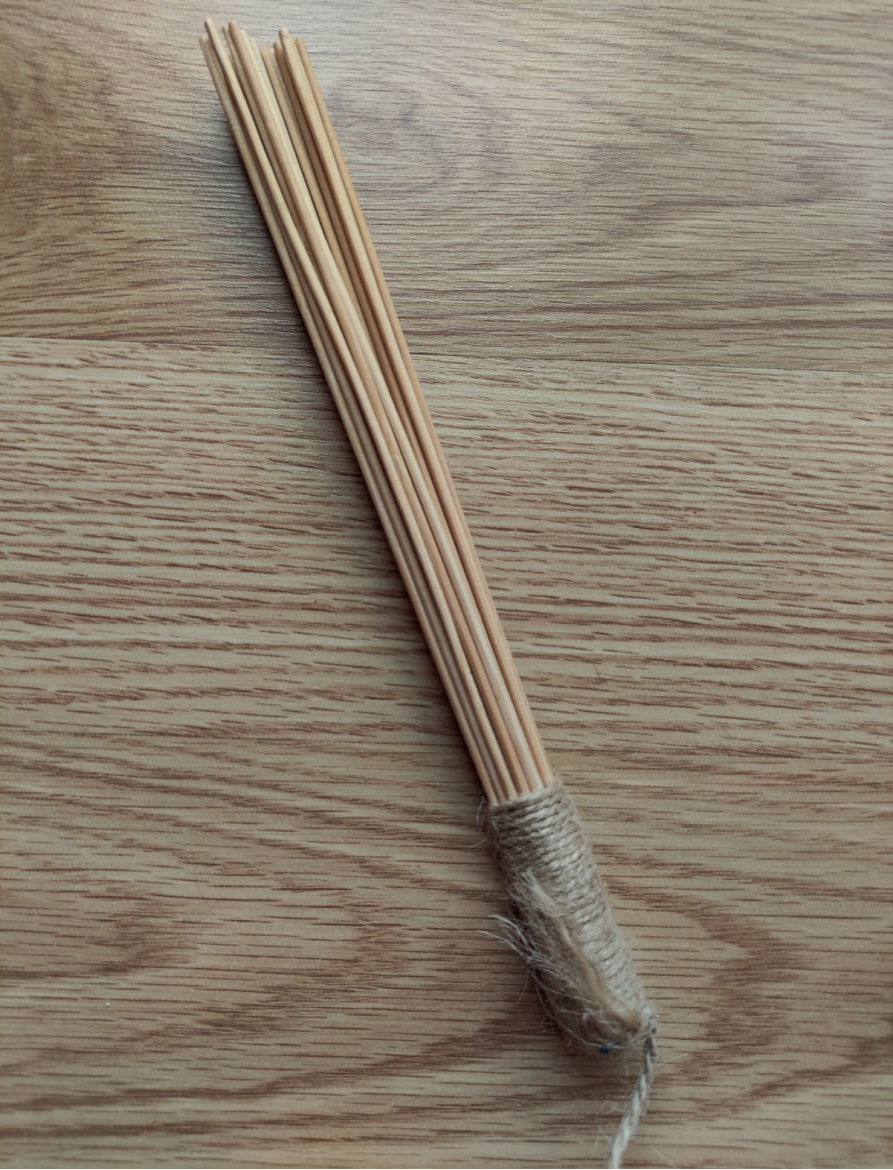
Görsel 8. Çöp şişlerden bagetler; Yücesan, 2020.

olduğunda bant kesilir. Ahşap çöp şişlerin görünen alt kısımları da elektrik bandı ile sarılarak kapatılır. Son olarak elektrik bandının görünmemesi ve daha konforlu bir kullanım için bu bölge yumuşak bir ip ile sarılarak kaplanır. Aynı şekilde 2 adet baget hazırlanır. Böylece tutacak bölümleri de tamamlanmış olan bagetler kullanıma hazır olacaktır(*Bu tasarım çalışmasının uygulama basamakları Milli ve Özyoğurtçu, (2017) tarafından paylaşılan materyal görseli (s. 63) üzerinden yapılandırılmıştır).