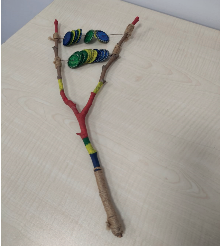
Görsel 2. Sapan tef, Yücesan (2020)

'Y' şeklinde ağaç dalları istenilen şekilde boyanır ve kurumaya bırakılır. Ardından eski gazoz kapaklarının ortalarına çekiç ve çivi yardımı ile delikler açılır (Her gazoz kapağı için tam orta kısmına bir delik olacak şekilde). Bu deliğin yeterli büyüklükte olmasına özen gösterilir. Metal tel, 'Y' şeklinde ağaç dalının bir ucuna sıkıca bağlanır. Ardından orta kısımları delik olan gazoz kapakları bu tele geçirilir ve telin diğer ucu ağaç dalının diğer ucuna sıkıca bağlanır. Bu noktada gazoz kapaklarının rahatça hareket edebiliyor olmalarına özen gösterilir. Bu amaçla gazoz kapaklarının sayıları, büyüklükleri ile ağaç dalının büyüklüğü gözden geçirilip düzenlenebilir. Böylece sapan tef kullanıma hazır hale gelir (Bkz. Erol, 2015, s. 54,55; Öztürk, 2007, s. 43).