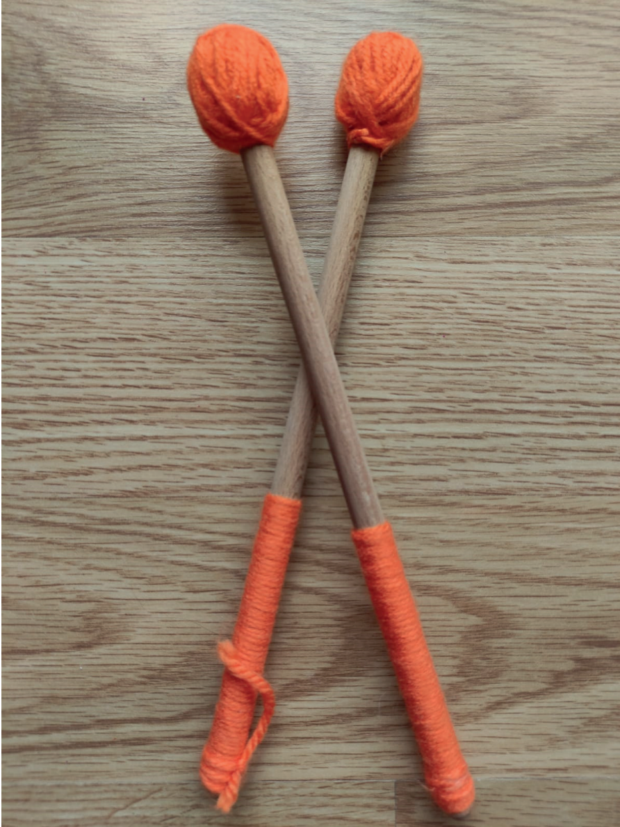
Görsel 7. İple küçük bagetler; Yücesan, 2020.