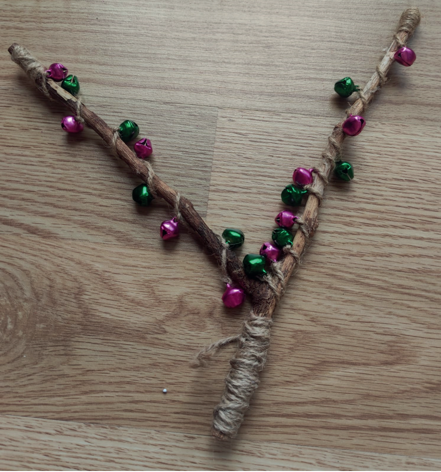
Görsel 3. Çıngırak, Yücesan (2020)

İstenilen şekilde ve boyda bir ağaç dalı bulunur. Yün ip ile dalın tutulduğu kısım sarılır ve bir çeşit yumuşak tutacak bölümü oluşturulur. İpe, belli aralıklarla ziller geçirilir ve sabitlenir. Ardından ip, ahşap çubuğa sarılır(çubuk ip ile sarmalanır). Sarma işlemi bittiğinde, ip çubuk üzerinde bulunduğu yere bağlanarak sabitlenir(Bkz. Erol, 2015, s. 52,53). Böylece çıngırak çalima hazır hale gelir.