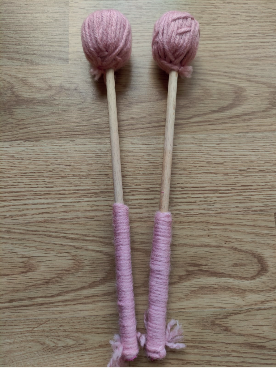
Görsel 6. İple büyük bagetler, Yücesan, 2020

*Bu çalışmada farklı büyüklükte şişe mantarları kullanarak farklı büyüklükte bagetler de tasarlanabilir(Bkz. Görsel 7).