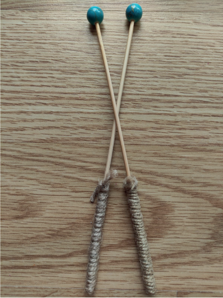
Görsel 4. Cam boncuklarla bagetler, Yücesan, 2020.