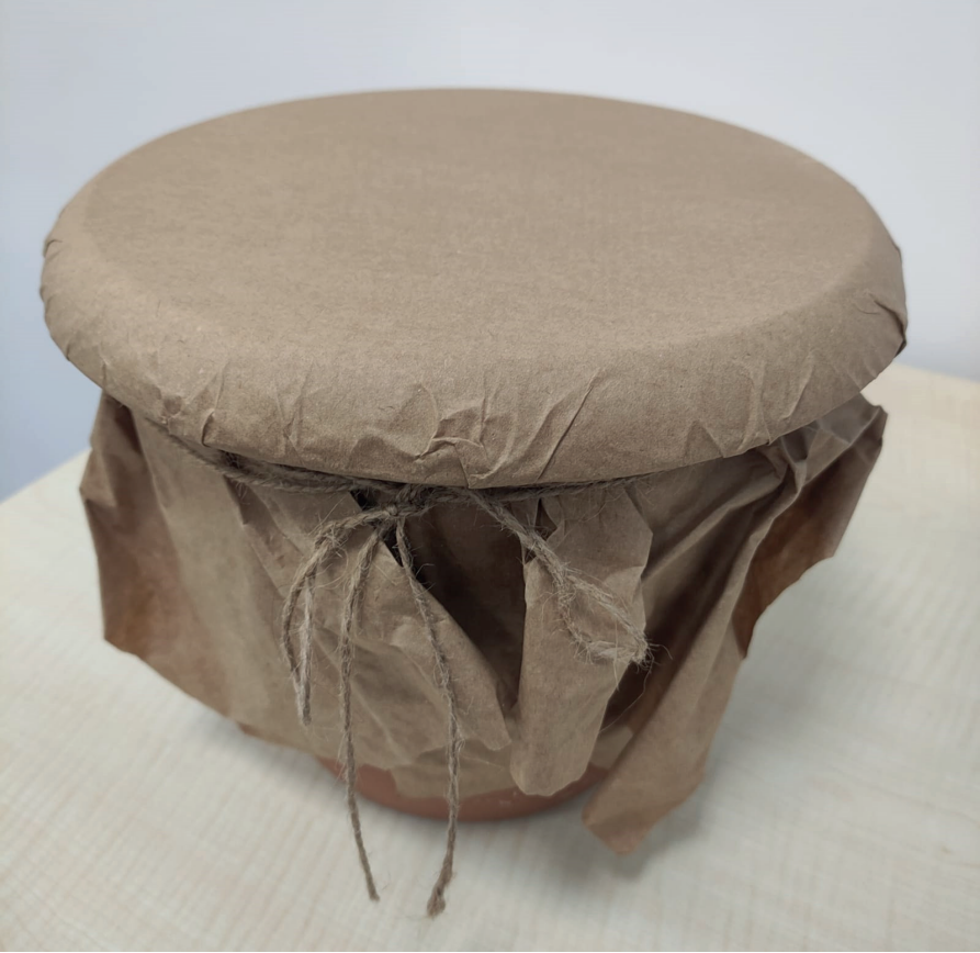
Görsel 1. Saksı davul, Yücesan (2020)

Öncelikle tutkal bir miktar su ile sulandırılır ve saksının ağız bölgesi temizlenir. Parşömen kağıtları (5-6 adet) saksının ağız kısmından biraz daha geniş olacak şekilde kesilerek hazırlanır. Sulandırılmış tutkal, hazırlanan parşömen kağıdının tüm yüzeyine sürülür ve kağıt, saksı üzerine yapıştırılır. Aynı uygulama 5-6 kat olacak şekilde diğer kağıtlarla da tekrarlanır. Saksının ağız kısmının dışında kalan kağıtlar saksının kenarlarına doğru bükülür. Bir ip, saksının ağızından 3-4 cm aşağıya (kenar kağıtları sabitlenecek şekilde) birkaç tur sarılır. Kağıtların kurumması için bir süre beklenir. Son olarak davulu sağlamlaştırmak için yüzey kısmı bir koli bandı ile kaplanabilir. Saksı davul tasarlanırken kağıt katları arttıkça daha kalın sesler elde edilebilir. Ek olarak davulu kullanırken mantar babetlerden yararlanılması ve çok sert vuruşlar yapılmaması davulun daha uzun süre kullanılabilmesi açısından önemli olacaktır. (Bkz. Öztürk, 2007, s. 9).