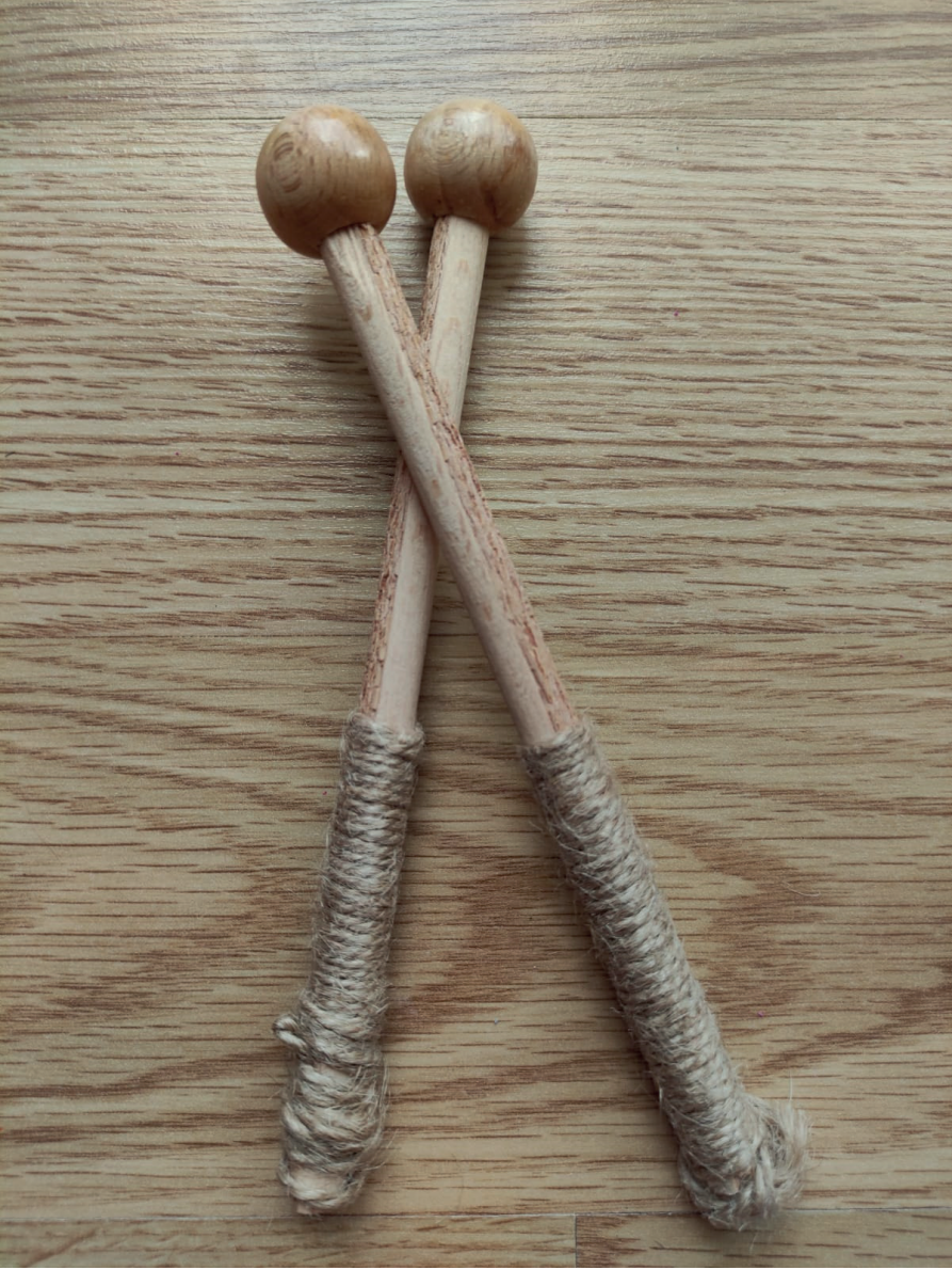
Görsel 5. Ahşap boncuklarla bagetler, Yücesan, 2020.